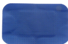
Sanoblué jumbo 60x38mm