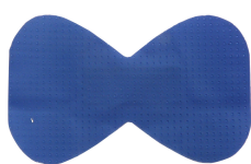
Sanoblué doigt 75x46 mm